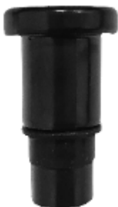
Kleiner runder Aufsatz